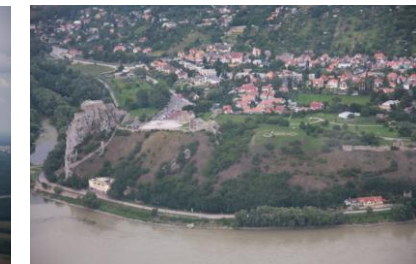
Most rowerowy "Chuka Norissa", Bratysława , zamek Devín