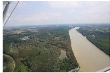
„Slovak Hungaroring“, granice państwowe nad Dunajem