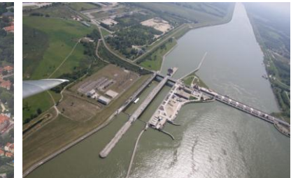
Lotnisko Győr, kąpielisko termalne w Mosonmagyaróvár, tama w Gabčíkowie