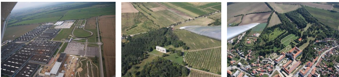
Augbau der VW-Halle in Bratislava, Schloss in Valtice