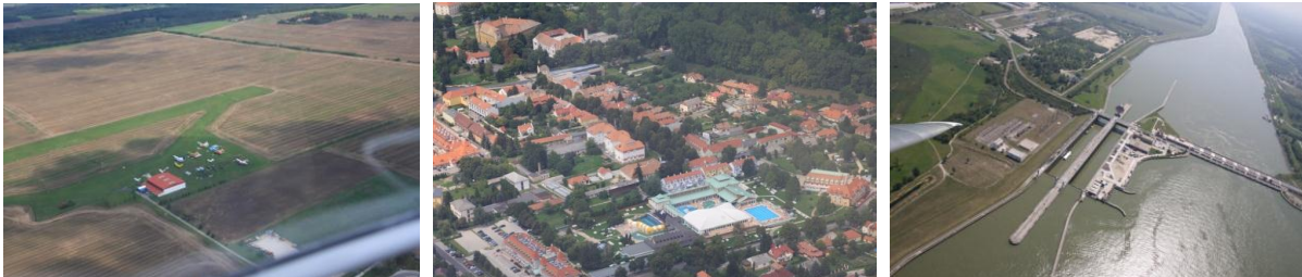
Sprtrflugplatz bei Győr, Thermalbad in Mosonmagyaróvár, Donausperre in Gabčíkovo