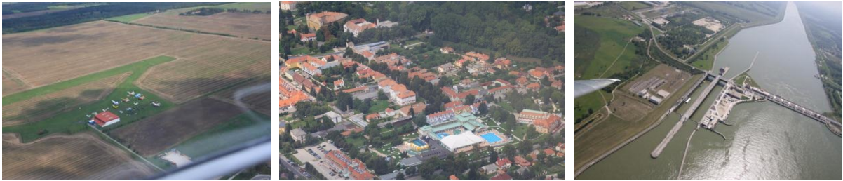
Športové letisko pri Györi, termálne kúpalisko v Mosonmagyaróvári, priehrada v Gabčíkove