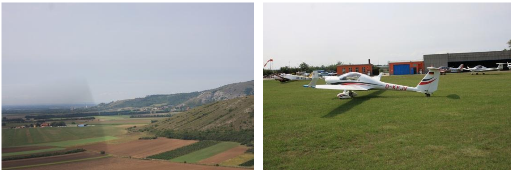
Finále v Spitzerbergu, prestávka na kávu v Spitzerbergu