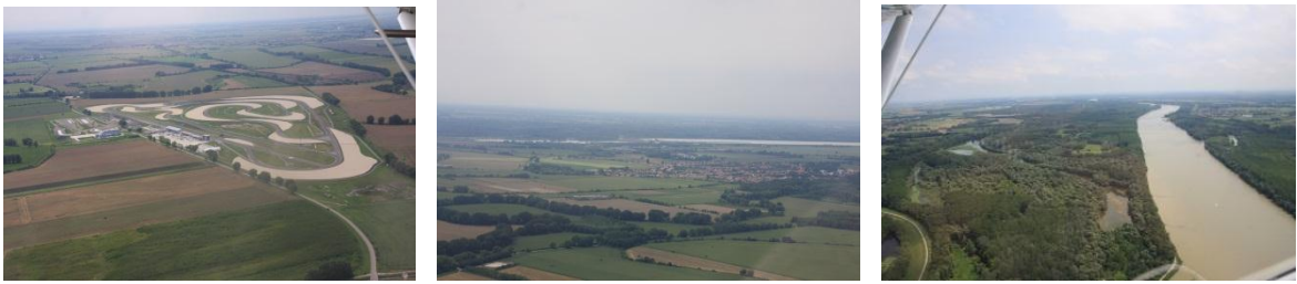
„Slovenský Hungaroring“ v Orechovej Potôni, dunajská štátna hranica, meandre Dunaja a lužné lesy