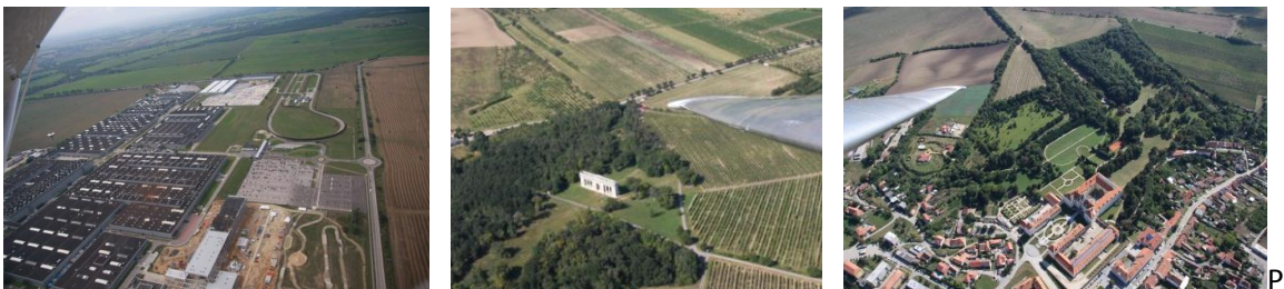
Výstavba VW v Dn Vsi, neznámy objekt pri Valticiach, Valtický zámok,